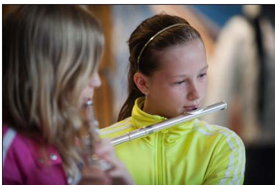
Upptredande i Strand galleria.