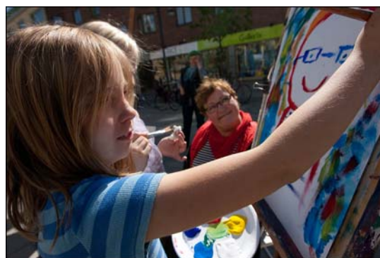
Porträttmålning av kommunalrådet Yvonne Stålnacke.