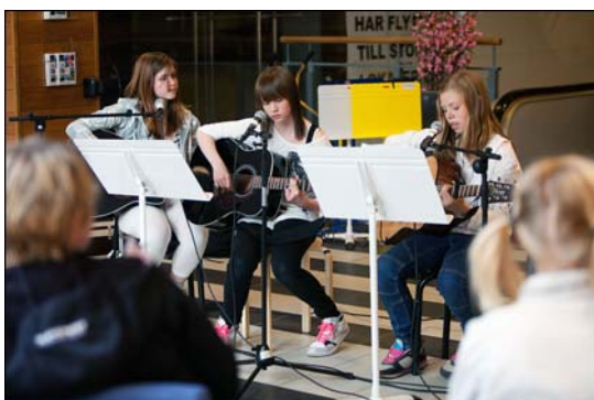
Upptredande i Strand galleria.