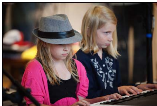
Upptredande i Strand galleria.