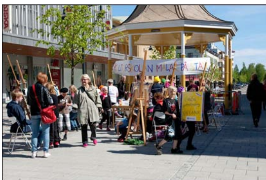
Porträttmålning Gula paviljongen