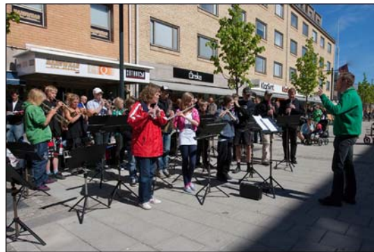
The music band på Storgatan.