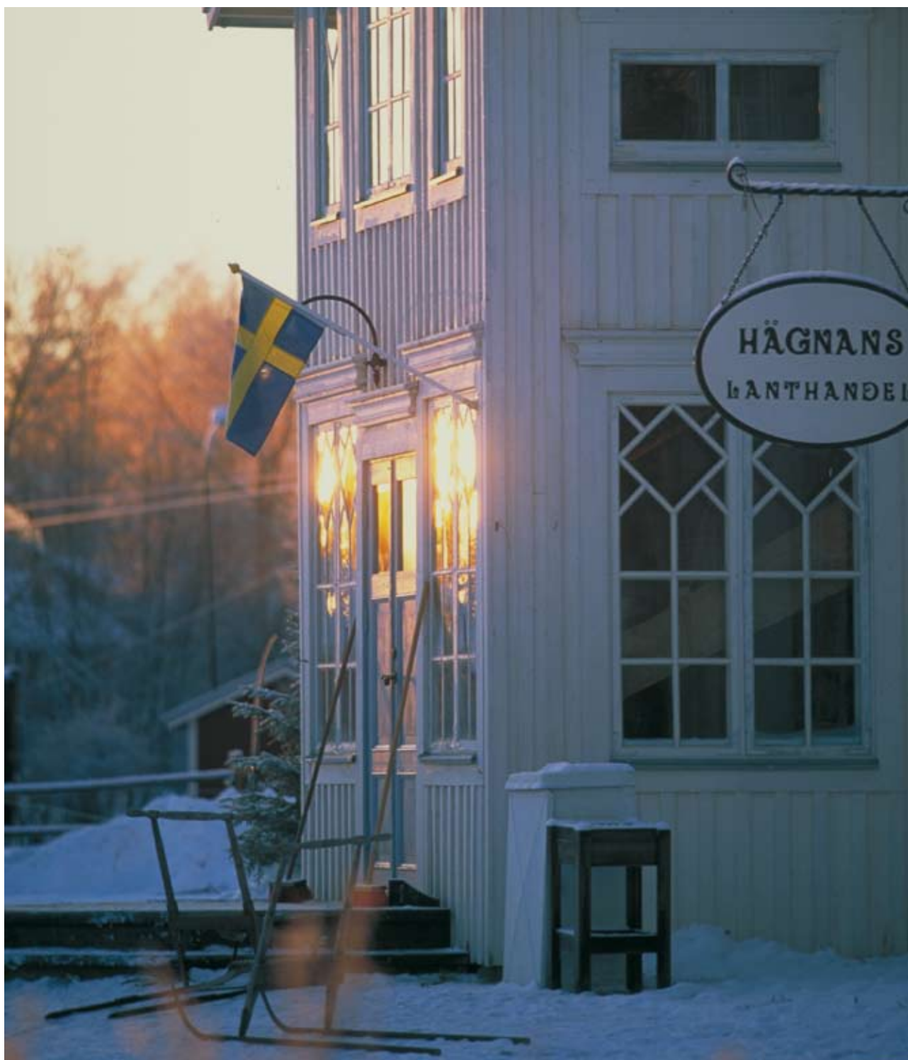
Lanthandeln på Friluftsmuseet Hägnan i Gammelstad.