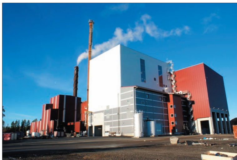
BEAB, ett företag som bränner avfall som ger energi i form av fjärrvärme och el.

Alla förbränningsanläggningar har inte tillstånd att ta emot alla typer av brännbart bygg- och rivningsavfall.